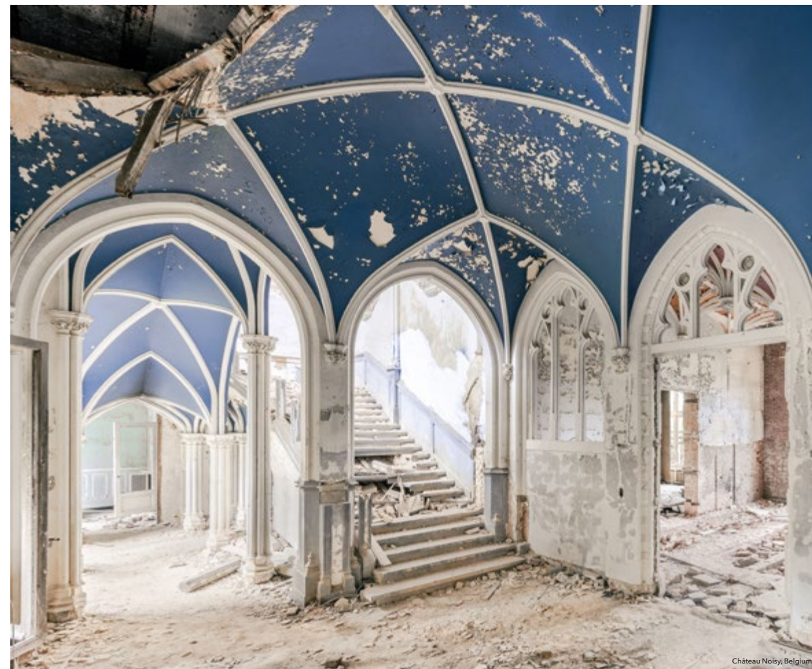
Château Noisy, Belgium

de Engelse architect Edward Milner, die echter stierf voor de voltooiing ervan. Het kasteel heeft verschillende functies vervuld en is ook bekend als Château Miranda of Home de Noisy. Dat laatste was de naam toen het als weeshuis diende. Verder kwam het tijdens de Tweede Wereldoorlog in handen van de Duitsers, werd het nadien ter beschikking gesteld van de NMBS, werd het een vakantieverblijf en woonde er een graaf. Sinds 1991 staat het gebouw leeg en raakte het in verval. Uiteindelijk werd het in 2017 gesloopt. Gelukkig wist Van de Velde de sfeer van dit prachtige kasteel daarvoor nog te vereeuwigen. “Dit was een klassieker in België. Een