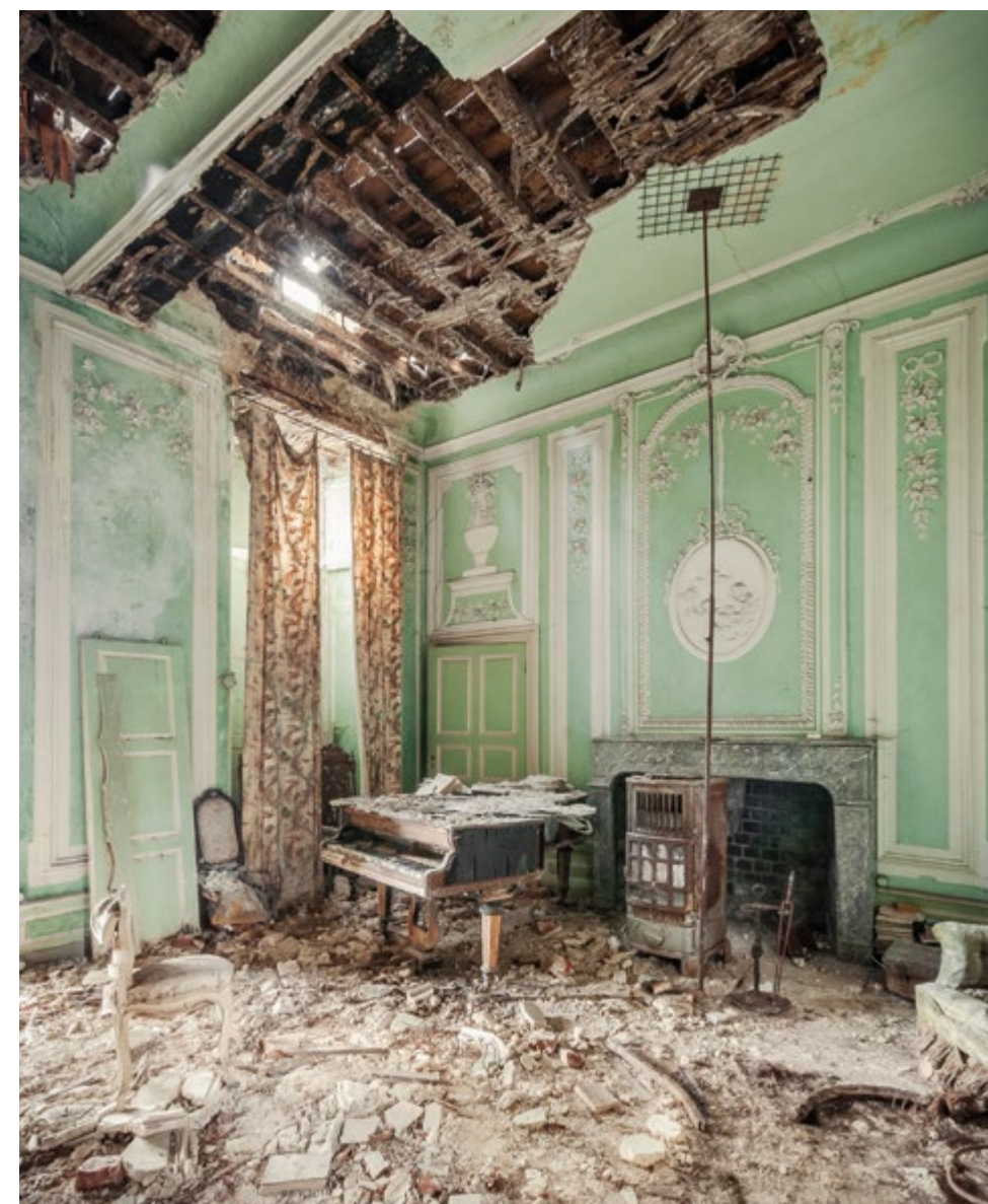
Kasteel van Heers

Chigi Albani in Soriano. Dit paleis is een indrukwekkend architectonisch complex uit de renaissance. “Het paleis werd ontworpen en gedeeltelijk gebouwd in de jaren dat het leengoed van Soriano toebehoorde aan de Madruzzo, een adellijke familie uit Trentino die het leengoed van Soriano in 1560 verkregen hadden van paus Pius IV. In 1715 werd het gekocht door de Albani familie, die de bouw van het paleis en de restauratie van talrijke monumenten in het park voltooide. In de eerste helft van de negentiende eeuw