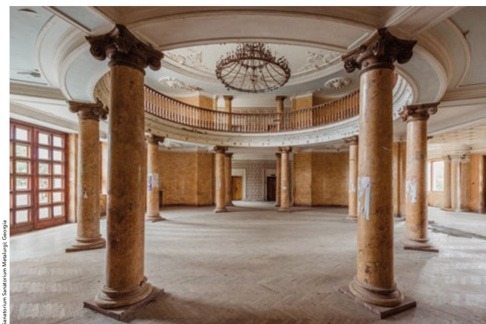
Sanatorium Sanatorium Metalurgi, Georgia

Als laatste tonen we jullie Villa Fortuna in Marche, waar Van de Velde tot zijn verrassing ook een prachtige fresco vond. “Italië staat vol met verlaten boerderijen en kleine huisjes. Het is onmogelijk om ze allemaal af te gaan. Vaak zijn het standaardwoningen waar het voor een fotograaf niet zo interessant is. Maar soms stop je toch eens, en check je een ogenschijnlijk saai gebouwtje, waar dan plots een fresco op je afkomt. Dit is zo’n huisje. Geen naam, geen historiek, zero informatie van terug te vinden, maar wel met een prachtig salon met fresco’s rondomronnd. Wat je hier ziet is een afbeelding van Fortuna, de Romeinse godin van geluk. Een avondse Vespa scooter maakt het plaatje compleet. Het was een bizar huisje: een stuk links, volledig gerestaureerd, modern, met dubbel glas, nieuwe muren, alle nutsvoorzieningen, maar totaal verlaten. Een stuk rechts, enkele eeuwen oud, met fresco’s, en zo sterk