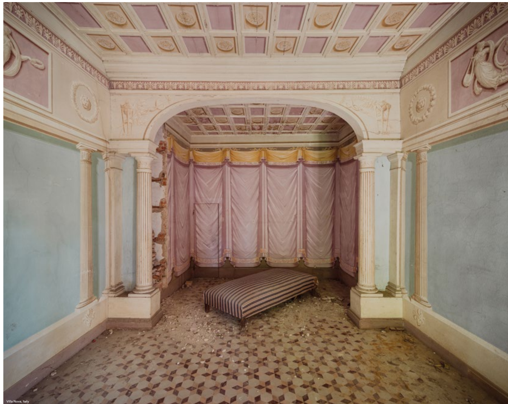
Villa Nova, Italy