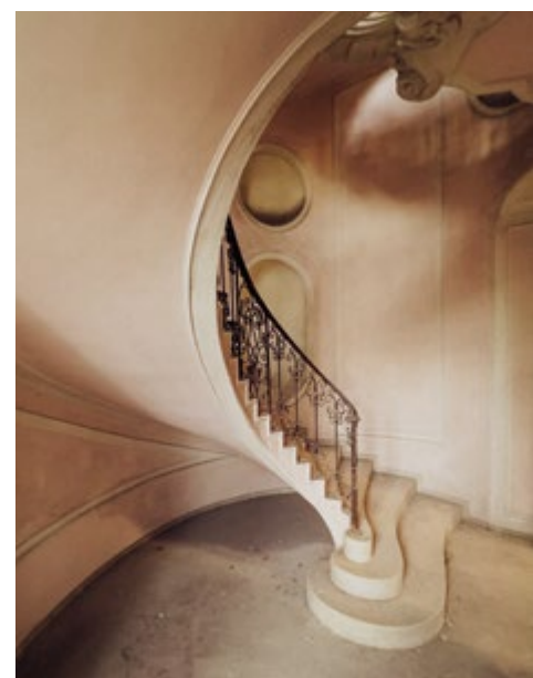
Castello Pergolino, Italy

van mijn favoriete locaties. Mijn eerste bezoek was reeds in 2007, en toen was het al in een erg vervallen toestand. Het kasteel was toen nog onbekend, en ik had verwacht dat ik er helemaal alleen zou zijn. Niets was minder waar. Op één van de bovenverdiepingen, op een erg gevaarlijke plek, stond ik plots oog in oog met een Franse fotografe. We waren beiden enorm stil geweest en hadden al die tijd geen weet van elkaar. Grappig moment. Ik ben vele malen teruggekeerd, en het was pijnlijk om te zien hoe snel alles achteruit ging.”