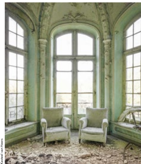
Kasteel van Heers

Van België reizen we naar Georgië waar we jullie enkele bestemmingen tonen die een vakantiegevoel van weleer oproepen. Als eerste is er Sanatorium Metalurgi. Dit is een oud sanatorium of herstellingsoord, uit het USSR-tijdperk. “Hardwerkende staatsburgers werden vaak op gezondheidsvakanties gestuurd naar één van de vele sanatoria van het rijk. Naast de bezoeken aan thermale baden en spa's boden deze sanatoria een combinatie van gezondheids- en medische kuren. Deze instellingen behoorden ooit tot de meest innovatieve gebouwen van die tijd,” vertelt Van