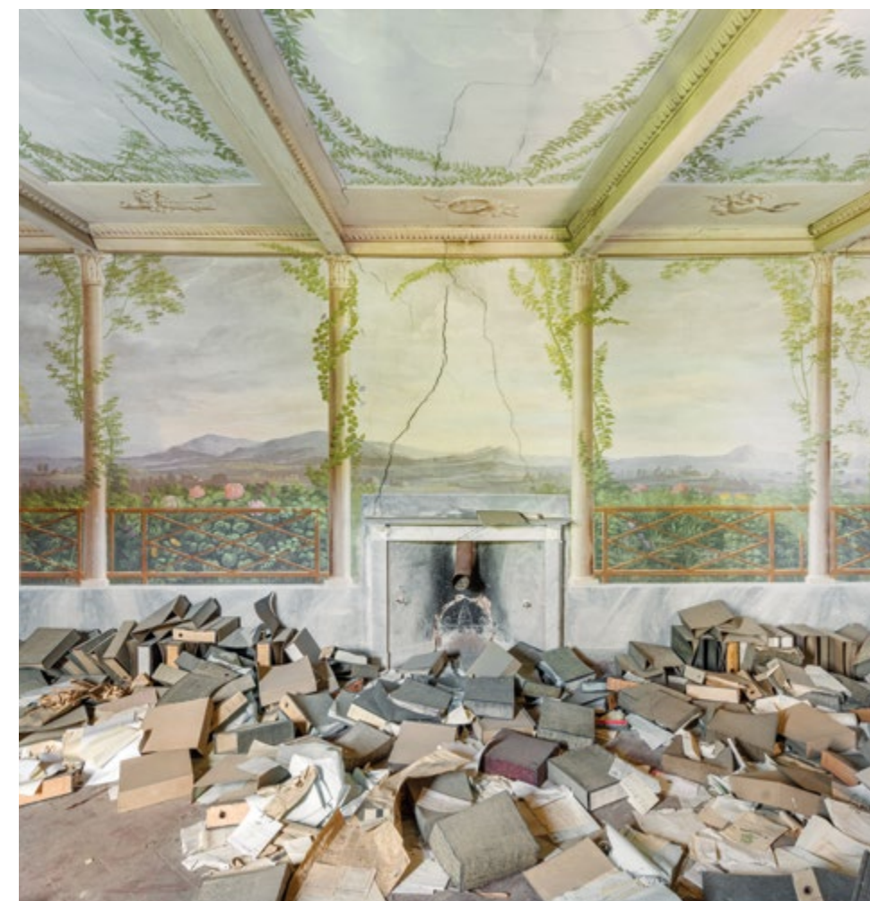
Villa Nova, Italy